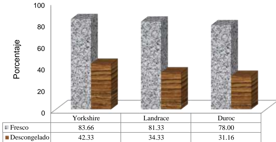
Gráfica 2. Porcentaje de espermatozoides vivos en semen fresco y descongelado en los diferentes grupos raciales estudiados.