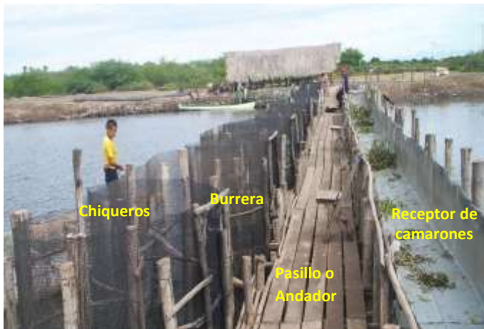
Figura N° 7. Tapa "El Colorado", el más grande del estado de Nayarit.