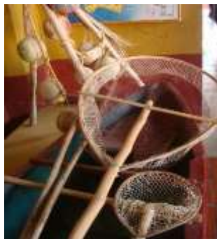
Figura N° 9 "Tapeiste," recolector de camarones. Al fondo Barcinas de Camarón. Museo del Sitio, Isla de Mexcaltitán.