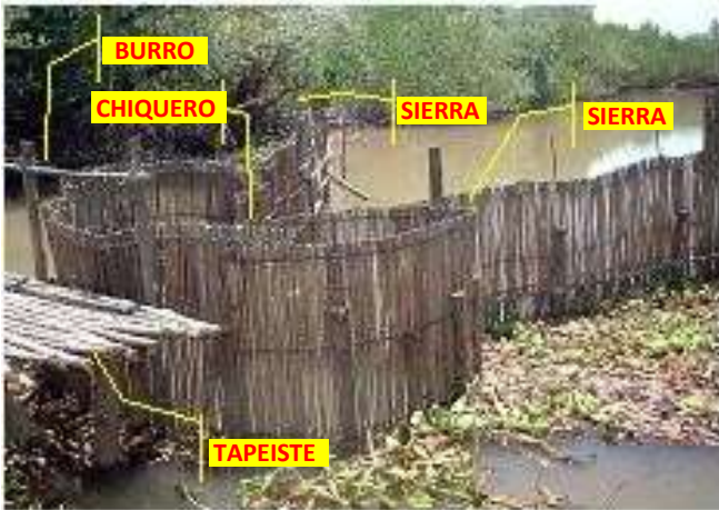
Figura N° 5 Partes de que consta un Tapo.