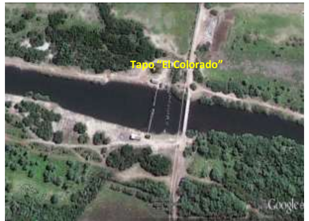
Figura N° 8. Tapa "El Colorado" vista Satelital Google earth.