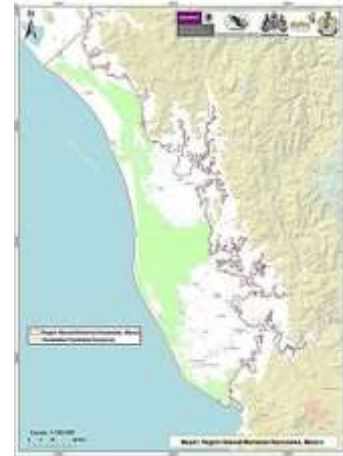
Figura N° 2 Región de Marismas nacionales.