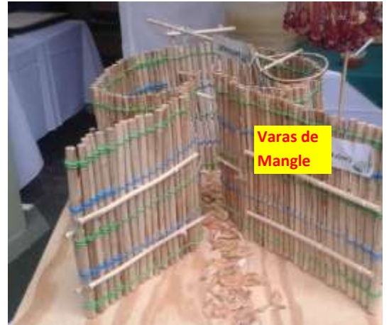
Figura N° 6 Chiquero del Tapo.