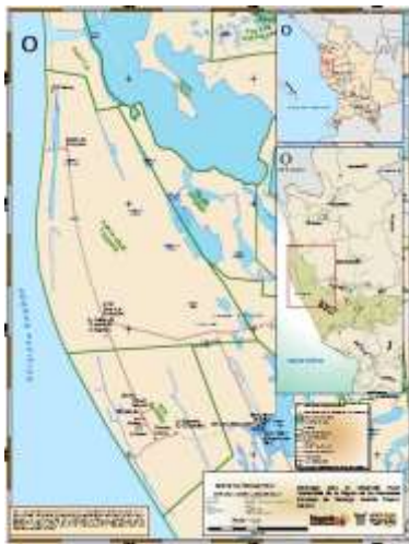
Figura N° 3 Los ejidos de Santa Cruz y del ejido de San Andrés, comarca de las Haciendas, municipio de Santiago Ixcuintla.