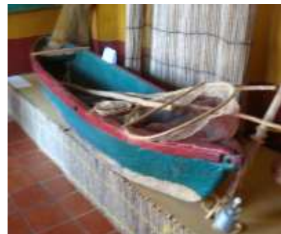
Figura N° 10 Canoa y artes de pesca.