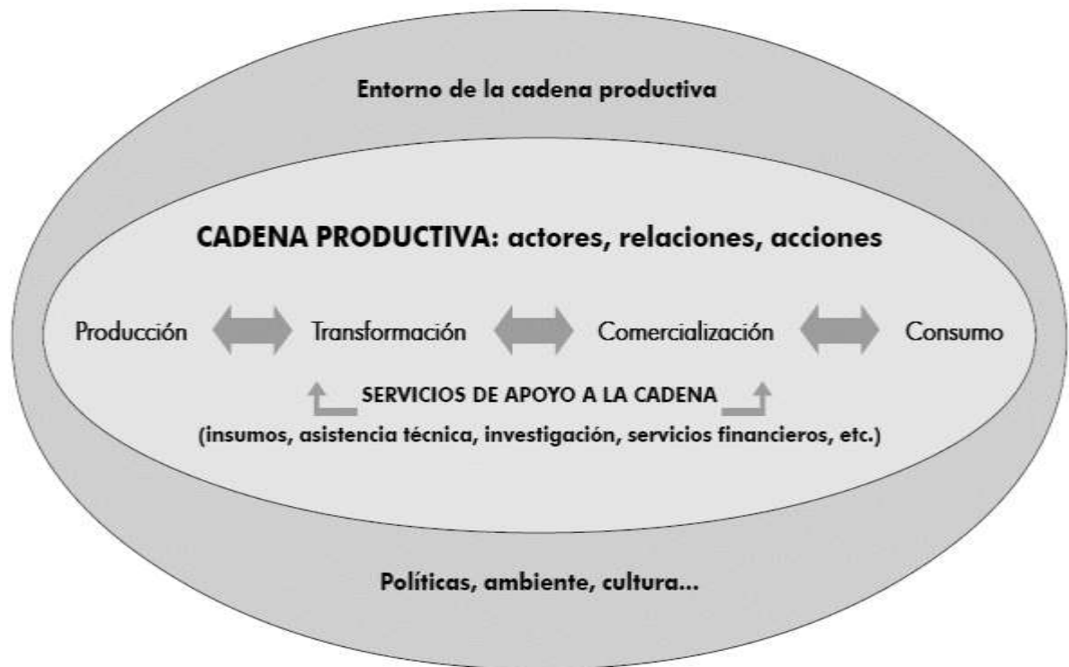
Figura no. 2 La cadena productiva y sus actores.

Según Heyden y Camacho (2004), se presenta un esquema de la cadena productiva y sus actores principales. Véase figura no. 2.