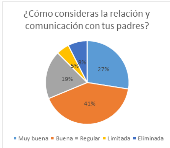
Ilustración 1 Gráfica relación padres e hijos

Este apartado presenta el análisis de los datos recabados a través de un cuestionario, a partir de este se presenta el diseño de la propuesta de un taller que brinde estrategias para