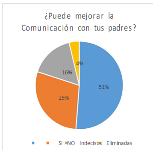
Ilustración 2. Mejora de la comunicación.

Mientras que los estudiantes que manifestaron tener regular ilimitada comunicación argumentan que sus padres no les ponen atención o bien que trabajan mucho.