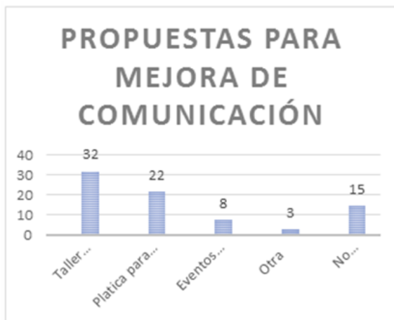
Ilustración 4. Propuesta de mejora de comunicación