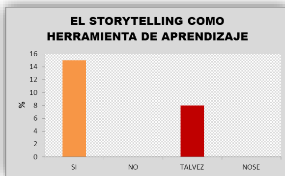
Ilustración 2: el storytelling como herramienta de aprendizaje

La gráfica muestra la importancia que tiene este instrumento del storytelling digital para los docentes dentro del aula de preescolar.