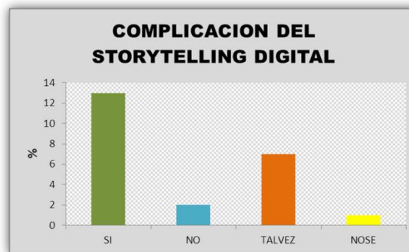
Ilustración 4: Complicación en la realización del storytelling digital

Se visualiza en la gráfica que la mayoría de los docentes afirman que el storytelling digital ayuda a motivar en los niños de preescolar por que llaman su atención desde el primer momento.