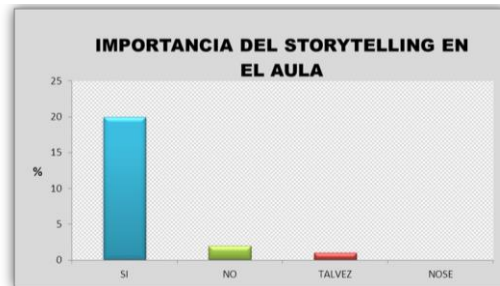
Ilustración 1: Importancia del storytelling digital en el aula

A continuación, se muestran los resultados obtenidos del cuestionario en forma de gráficas para un mejor análisis aplicado a los 23 docentes de educación preescolar de la zona escolar 053, ubicado en Santa Cruz Huatulco.