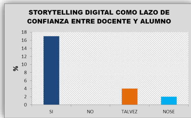
Ilustración 5: El storytelling digital como lazo de confianza entre docente alumno

Se muestra que muchos de los docentes afirman que el storytelling digital construye un lazo de confianza entre los dos de tal manera que el alumno se abre confiadamente a las actividades que realiza el docente.