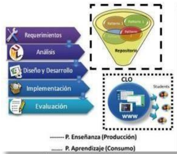
Figura 1. Metodología MACOBA

La Figura 1 , muestra la el proceso para la producción de OA, partiendo del nivel de requerimientos, pasando por el análisis y finalmente su desarrollo e implementación.